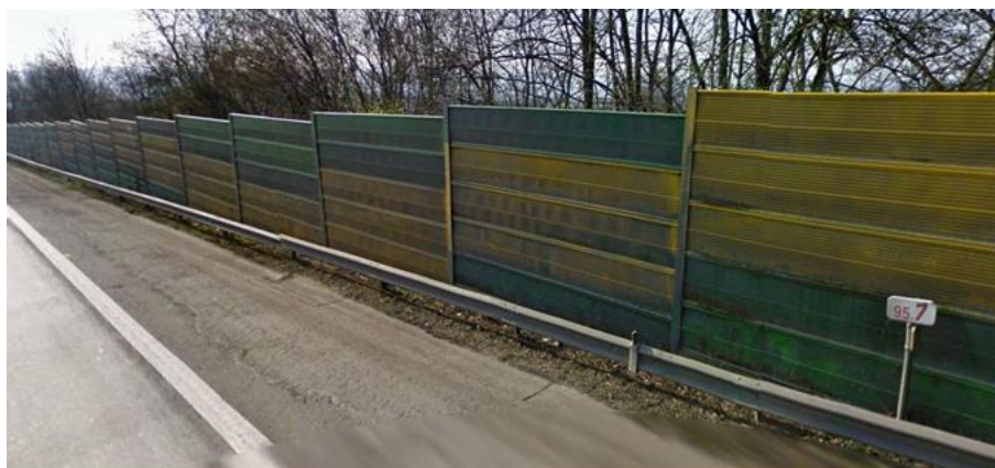
Situation avant travaux