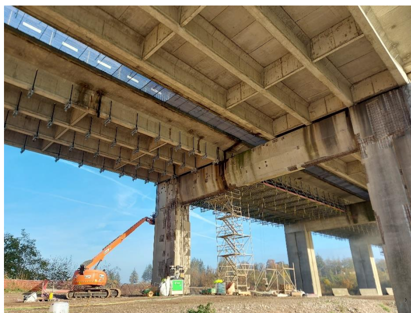
A gauche sur cette photo, le pont supportant habituellement les voies vers Namur, renforcé avec des étriers, à droite, le pont supportant habituellement les voies vers Liège.